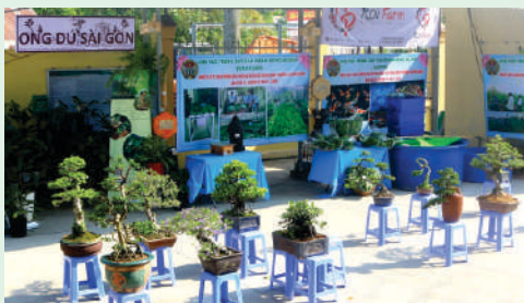
Khu vực triển lãm ảnh, trưng bày Bonsai kiểng chào mừng Đại hội đại biểu phường An Phú Đông, Quận 12.