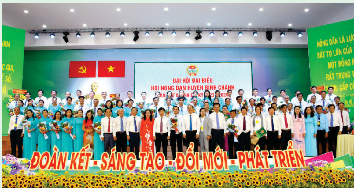
Đại hội đại biểu Hội Nông dân huyện Bình Chánh lần thứ XII, nhiệm kỳ 2023 - 2028.