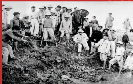
Bác Hồ tát nước chống hạn với bà con nông dân ở cánh đồng Quang Tổ, xã Đại Thanh, huyện Thanh Trì, Hà Nội (12/1/1958).

Là vị chủ tịch nước nhưng bác luôn dành thời gian để đi thăm hỏi tình hình và nói chuyện cùng với bà con nông dân xem còn có những khó khăn gì để cùng các đồng chí lãnh đạo tìm cách khắc phục. Hình ảnh bác xắn quần lội ruộng cùng tát nước, cùng đập luồng nước chống úng với bà con là những hình ảnh đẹp trong lòng người dân. Những năm tháng cuối đời Bác vẫn dành thời gian làm việc với các đồng chí phụ trách nông nghiệp và trước khi đi xa, trong di chúc Bác đã đề nghị miễn thuế nông nghiệp 1 năm cho các hợp tác xã để cho đồng bào có thể mát dạ mát lòng thêm niềm phấn khởi đẩy mạnh sản xuất. Đây chính là tinh thần cốt lõi của tư tưởng Hồ Chí Minh về nông nghiệp nông dân, thể hiện sâu sắc về việc khoan thư sức dân để tạo kế “Sâu rễ bền gốc” mà ông cha ta đã dạy.