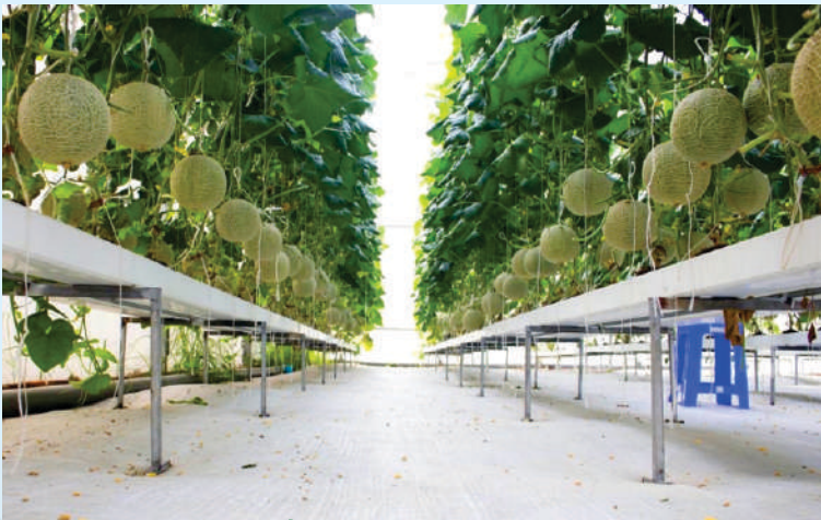
Hình ảnh các sản phẩm nông nghiệp ứng dụng công nghệ cao tại Thành phố Hồ Chí Minh

Đại hội đại biểu Đảng bộ Thành phố Hồ Chí Minh lần thứ XI, nhiệm kỳ 2020 - 2025 đã xác định: Thành phố sẽ tiếp tục tập trung phát triển nông nghiệp ứng dụng công nghệ cao, nông nghiệp sạch; đẩy mạnh chuyển dịch cơ cấu nông nghiệp; tập trung nghiên cứu, ứng dụng công nghệ sinh học để sản xuất giống cây, giống con chất lượng và năng suất cao. Đây chính là cơ sở để nông nghiệp thành phố tự tin với những định hướng ban đầu về nông nghiệp hiện đại, ứng dụng công nghệ cao trong suốt thời gian qua; đồng thời tiếp tục tập trung phát triển trong thời gian tới.