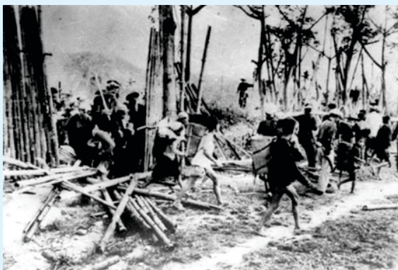
Được sự hỗ trợ của bộ đội, du kích, nông dân cùng đồng bào miền Nam nổi dậy phá áp chiến lược. Ảnh tư liệu.

Mở đầu cho phong trào đấu tranh của nông dân ngoại thành, là cuộc đấu tranh của 100 đại biểu nông dân tại cuộc họp tá điền ở Sài Gòn (ngày 9/3/1956) đưa yêu sách đòi bỏ chế độ đầu giá công điền để cấp phát cho dân nghèo và thi hành khế ước 3 năm. Tiếp sau đó là các cuộc đấu tranh ở toàn Nam Bộ, điển hình là các tỉnh Gia Định, Chợ Lớn, Tân An, Sóc Trăng... Đến cuối năm 1956, chính quyền Diệm-Nhu mới chỉ đem bán đầu giá được từ 1/2 - 1/3 đất công điền ở Nam Bộ. Sang năm 1957, mở đầu là cuộc đấu tranh của đại diện nông dân 14 tỉnh Nam Bộ trong tháng đầu năm đòi chính quyền Diệm - Nhu định lại giá đất canh tác.