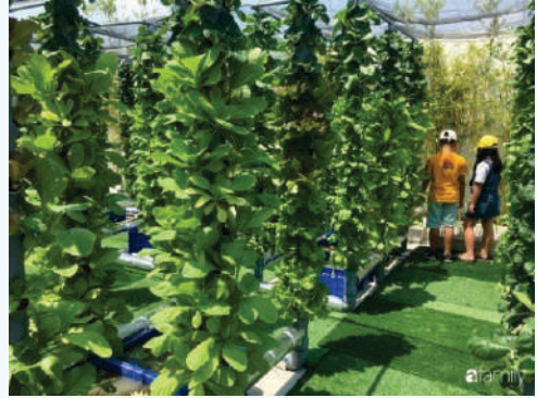
Sản xuất chuyên nghiệp (ảnh trái), sản xuất quy mô nhỏ (ảnh phải)