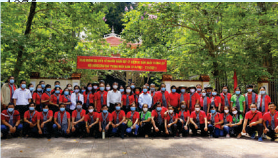
Cán bộ, hội viên nông dân Thành phố Hồ Chí Minh đến viếng, dâng hương, chụp ảnh lưu niệm tại Bia tường niệm Cơ quan Hội Nông dân Giải phóng miền Nam Việt Nam.

Năm 1961, một sự kiện đặc biệt quan trọng với nông dân miền Nam, vào ngày 21/4/1961, Hội Nông dân Giải phóng miền Nam chính thức được thành lập và trở thành thành viên của Mặt trận dân tộc giải phóng. Sự ra đời của Hội Nông dân giải phóng là mốc lịch sử đánh dấu sự phát triển của tổ chức nông dân; sau đó có tới hàng ngàn cơ sở nông hội ở các tỉnh, huyện, xã... được phục hồi trong thời gian sau ngày Đồng khởi. Sau khi thành lập, Hội ra tuyên ngôn theo chương trình hành động của Mặt trận Dân tộc Giải phóng miền Nam Việt Nam (thành lập ngày 20/12/1960) nhằm thực hiện các mục tiêu: giải phóng dân tộc, hòa bình, thống nhất đất nước và thực hiện các quyền dân sinh dân chủ. Đồng thời nhấn mạnh trách nhiệm, quyền lợi nông dân miền Nam trong kháng chiến chống Mỹ, cứu nước và tin tưởng vào thắng lợi cuối cùng của cuộc kháng chiến chống Mỹ. Từ đó về sau, nông dân miền Nam và nông dân khu Sài Gòn - Gia Định đã luôn luôn là một hậu thuẫn vững chắc nhất, vừa là nơi trú ẩn an toàn cho cách mạng, vừa là hậu phương sẵn sàng vì cuộc kháng chiến, để đi tới ngày toàn thắng Đại chiến mùa Xuân