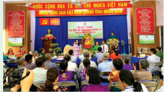
Đại hội đại biểu Hội Nông dân Phường 28, Quận Bình Thạnh.