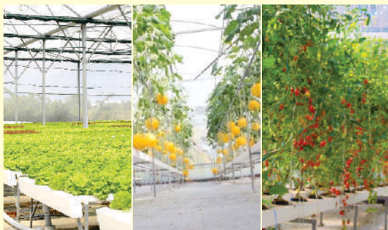
Hình ảnh các sản phẩm nông nghiệp ứng dụng công nghệ cao tại Thành phố Hồ Chí Minh.