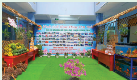
Triển lãm hình ảnh, sản phẩm nông nghiệp tiêu biểu của Hội Nông dân xã Phong Phú, Huyện Bình Chánh