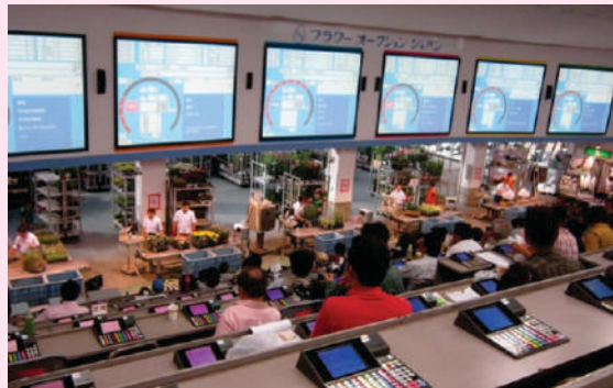
Sàn đấu giá nông sản, nơi các sản phẩm nông nghiệp của nông dân được giao dịch thông qua HTX tại Nhật Bản.