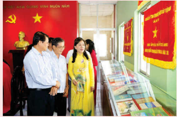
Các đại biểu tham quan phòng truyền thống của Hội Nông dân Thành phố.