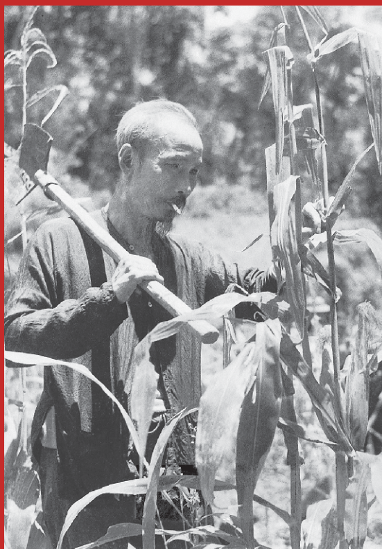
Chủ tịch Hồ Chí Minh kêu gọi đồng bào và chiến sĩ thực hiện khẩu hiệu: “Thực túc bình cường”, và hằng ngày Người dành thời gian tăng gia sản xuất.