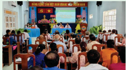
Đại hội đại biểu Hội Nông dân Xã Thạnh An, Huyện Cần Giờ.