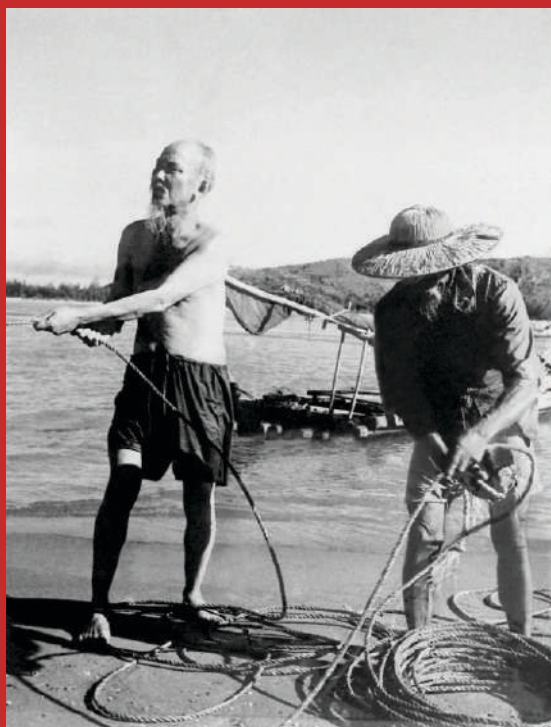
Chủ tịch Hồ Chí Minh cùng kéo lưới với bà con ngư dân ở vùng biển Sầm Sơn, tỉnh Thanh Hóa (7/1/1960).