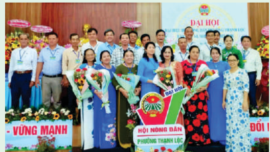
Đại hội đại biểu Hội Nông dân Phường Thanh Lộc, Quận 12.