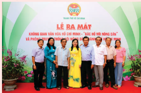
Các đại biểu chụp hình lưu niệm tại Lễ ra mắt không gian văn hóa Hồ Chí Minh, chủ đề “Bác Hồ với Nông dân” tại cơ quan Hội Nông dân Thành phố.

hoạt hằng ngày của Bác. Tại đây, những hoạt động nổi bật, những mô hình, cách làm hiệu quả và những cá nhân tiêu biểu trong học tập và làm theo tư tưởng, đạo đức, phong cách Hồ Chí Minh sẽ được giới thiệu. Gian ngoài được bố trí “Góc nhỏ nhà nông” trưng bày các sản phẩm nông nghiệp tiêu biểu của nông dân Thành phố.