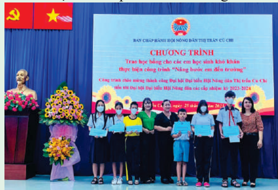
Công trình “Nâng bước em tới trường” của Hội Nông dân thị trấn Củ Chi.

- Hội Nông dân thị trấn Củ Chi, huyện Củ Chi phát động cán bộ, hội viên nông dân đóng góp, ủng hộ rác thải nhựa, đồng thời vận động các nguồn lực xã hội thực hiện công trình “Nâng bước em tới trường”. Qua đó, trao 7 học bổng cho con em hội viên nông dân có hoàn cảnh khó khăn (mỗi suất 1 triệu đồng), cùng đồng hành, hỗ trợ và động viên các em học sinh tiếp bước đến trường.