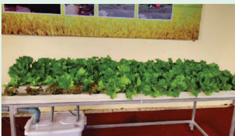
Mô hình trồng rau sạch tại Phường Bình Hưng Hòa B, Quận Bình Tân.