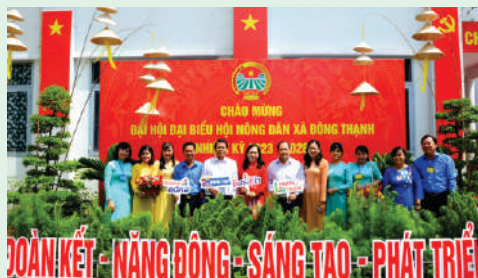
Hội Nông dân xã Đông Thạnh, Huyện Hóc Môn thiết kế các hashtag tầm tay tuyên truyền chào mừng Đại hội.