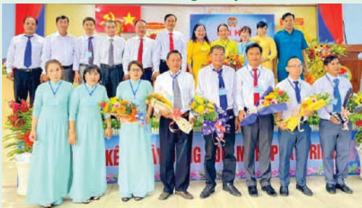
Đại hội đại biểu Hội Nông dân Xã Phong Phú, huyện Bình Chánh.