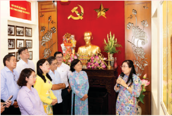
Các đại biểu nghe thuyết minh, giới thiệu về không gian văn hóa Hồ Chí Minh.