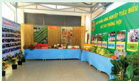
Trưng bày, triển lãm các sản phẩm nông nghiệp tiêu biểu của nông dân xã Tân Thông Hội, Huyện Củ Chi.