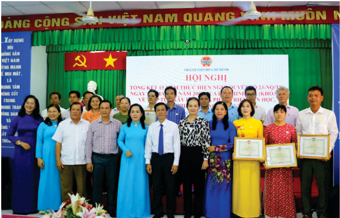
Các đồng chí lãnh đạo chụp ảnh lưu niệm cùng các tập thể, cá nhân có thành tích xuất sắc tiêu biểu trong thực hiện Nghị quyết số 23-NQ/TW ngày 16 tháng 6 năm 2008 của Bộ Chính trị (khóa X) về tiếp tục xây dựng và phát triển văn học, nghệ thuật trong thời kỳ mới.