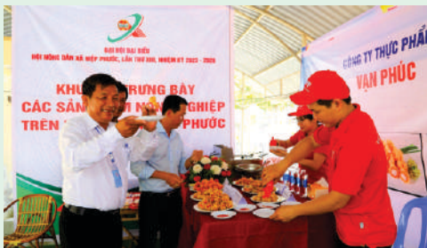
Trưng bày, triển lãm các sản phẩm nông nghiệp tiêu biểu của nông dân xã Hiệp Phước, Huyện Nhà Bè.