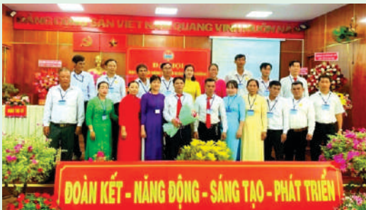
Đại hội đại biểu Hội Nông dân Xã Xuân Thới Thượng, Huyện Hóc Môn.