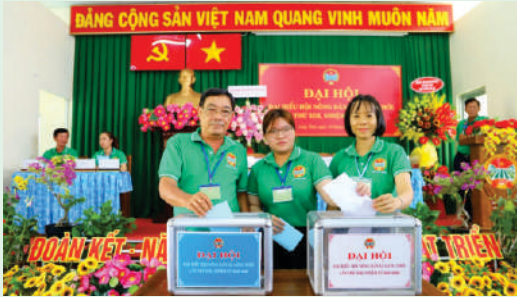
Đại hội đại biểu Hội Nông dân Xã Long Thới, Huyện Nhà Bè.

Chương trình Đại hội Hội Nông dân các xã, phường, thị trấn nhiệm kỳ 2023 – 2028 được diễn ra nghiêm túc, trang trọng, theo đúng quy định của Hướng dẫn thực hiện Điều lệ Hội Nông dân Việt Nam và các văn bản hướng dẫn của Hội Nông dân Thành phố Hồ Chí Minh. Đại hội đại biểu Hội Nông dân cấp xã nhận được sự quan tâm định hướng của lãnh đạo Hội Nông dân Thành phố Thủ Đức, các huyện, quận; sự chỉ đạo sâu sát của cấp ủy và sự hỗ trợ nhiệt tình của chính quyền, Mặt trận Tổ quốc Việt Nam và các tổ chức chính trị - xã hội, các đơn vị lực lượng vũ trang, các cơ quan, tổ chức, doanh nghiệp trên địa bàn.