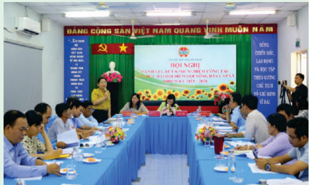
Các đại biểu tham dự hội nghị đánh giá rút kinh nghiệm công tác tổ chức đại hội điểm Hội Nông dân cấp xã nhiệm kỳ 2023 - 2028.

Hội Nông dân Thành phố Hồ Chí Minh. Hội nghị đã tập trung đánh giá, góp ý, thảo luận về các nhóm vấn đề xung quanh công tác tuyên truyền, công tác chuẩn bị và tổ chức Đại hội điểm Hội Nông dân cấp xã nhiệm kỳ 2023 - 2028. Hội nghị cũng đã thông qua Quyết định 6442-QĐ/HNDTW ngày 04/01/2022 của Ban Thường vụ Trung ương Hội Nông dân Việt Nam về ban hành Quy chế bầu cử trong hệ thống Hội Nông dân Việt Nam.