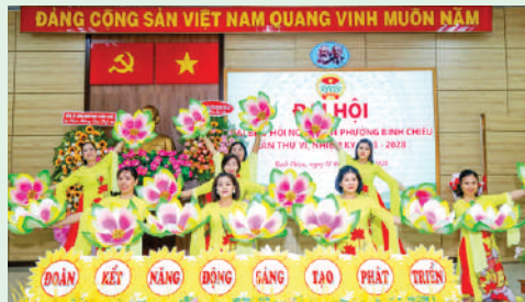
Biểu diễn văn nghệ chào mừng Đại hội đại biểu Hội Nông dân Phường Bình Chiểu, Thành phố Thủ Đức