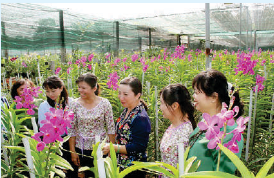
Nông dân trồng hoa lan xuất khẩu tại xã An Nhơn Tây, huyện Củ Chi.

Xuất thân từ những người dân bình dị, hiền lành, chất phác, song nông dân luôn có sự kết đoàn, hỗ trợ cùng nhau vượt qua mọi khó khăn, người nông dân Nam Bộ luôn đoàn kết chặt chẽ, cùng nhau xây dựng: Độc lập - Hòa bình - Thống nhất nước nhà. Do đó, trong đấu tranh, những người nông dân sẵn sàng hỗ trợ nhau, đoàn kết thành một khối sức mạnh to lớn, để không một thế lực nào có thể ngăn cản nổi trong sứ mạng góp phần to lớn để đấu tranh thống nhất nước nhà.