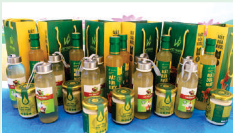
Hội Nông dân xã Bình Khánh, Huyện Cần Giờ trưng bày sản phẩm nông nghiệp tiêu biểu “Mật dừa nước”.