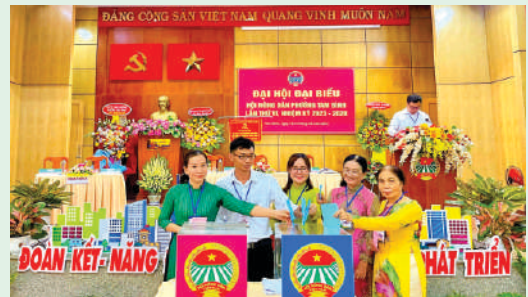
Đại hội đại biểu Hội Nông dân Phường Tam Bình, Thành phố Thủ Đức.