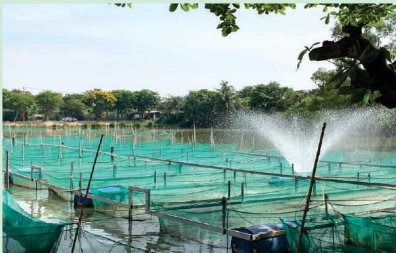
Một góc mô hình của anh Thuấn với hệ thống máy bơm tự động