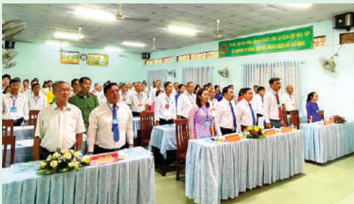
Đại hội đại biểu Hội Nông dân Xã Phước Vĩnh An, Huyện Củ Chi.