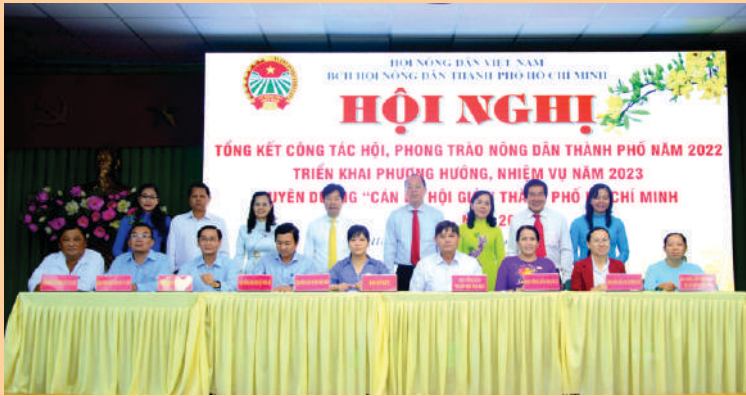
Hội Nông dân Thành phố Thủ Đức, huyện, quận và phường 28, quận Bình Thạnh ký kết giao ước thi đua năm 2023.